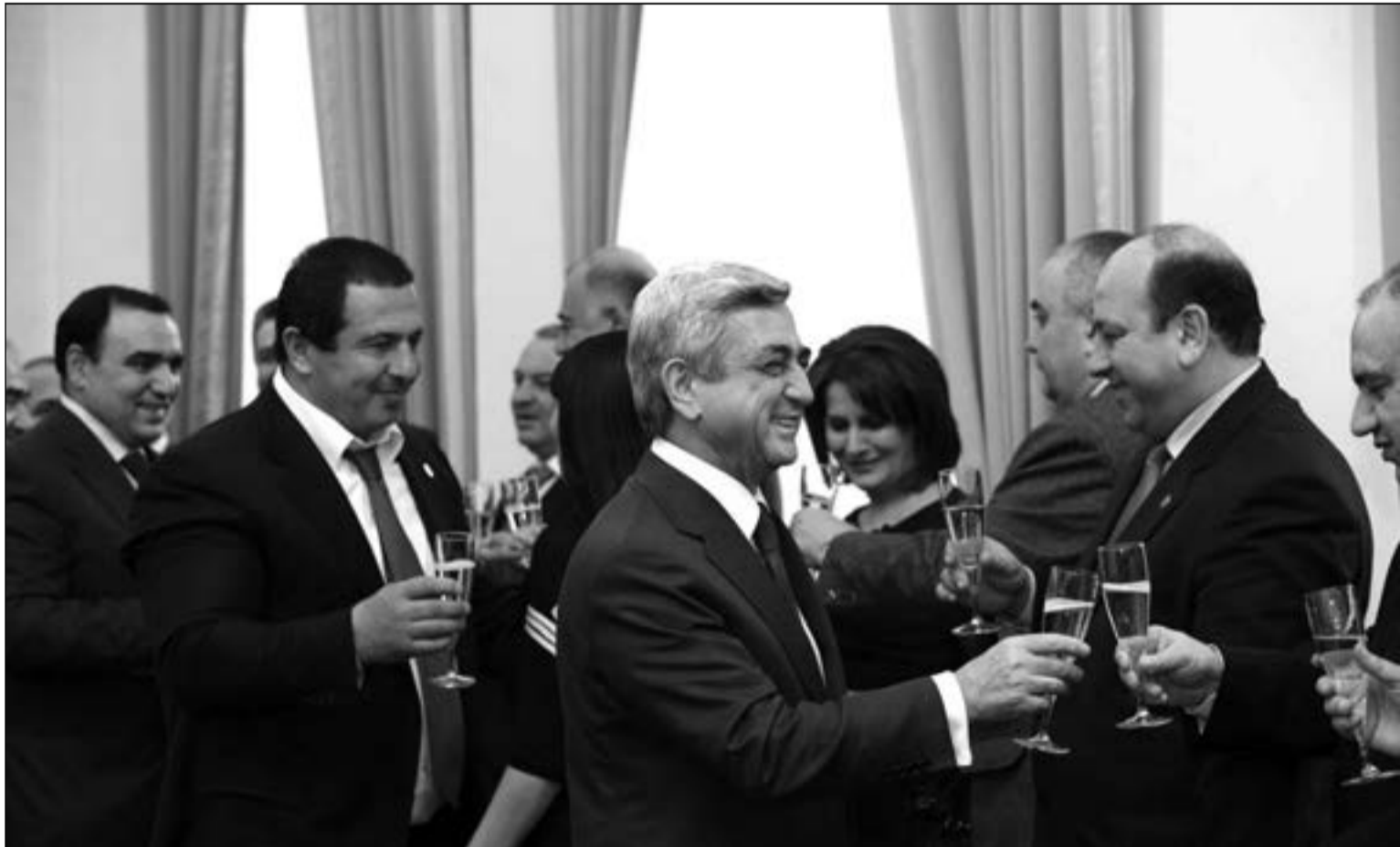
ՅՈՏՈՒՄՆԻՐ / ՄԻՍԻՎ, 2007թ.