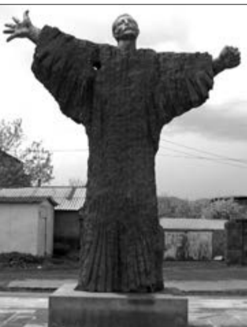
Վուրգ Ոսկանյանի հուշարձանը:

ցը բարձրացվեց քաղաքական, ավելի ստույգ՝ նախընտրական նկատառումներից ելնելով, տեղական ինչ-որ պաշտոնյաների մեղադրելու մտադրությամբ, թեև Սիսիանում իշխում է նաեւ այդ մտայնությունը: Եթե անգամ մնան մտադրություն ունեին տեղական որոշ գործիչներ, ապա հենց այդ օրերին երեւան եկան դրան նպաստող եւ հարցն իսկապես հրատապ դարձնող մոր հանգամանքներ: Խնդիրը, անշուշտ, սիսիանյան թերթերից մեկում հարցի մանրամասն քննարկման մեջ չէր: Բանն այն է, որ (ըստ մեր ունեցած տեղեկությունների) ապրիլի կեսերին մայրաքաղաքում թալանվել է Գեորգի Բաղդասարյանի արվեստանոցը: Գողացել էին նաեւ Վուրգի արձանի պղնձյա որոշ դրվագներ: Հենց այդ վանդալիզմն էլ պատճառ դարձավ որտեղով անգամ եւ ավելի հուժկու հնչեցնելու հարցը՝ իսկ ինչո՞ւ մինչեւ հիմա հուշարձանը քանդակագործի արվեստանոցից չի տեղափոխվել Սիսիան ու չի տեղադրվել: Քաղաքապետ Աղասի Հակոբջանյանն էլ նախընտրական հանդիպումներում, ի պատասխան այդ հարցի, խոստացել էր, որ մինչեւ ընտրությունների օրը՝ մինչեւ մայիսի 6-ը, խնդիրը կլուծվի: Եվ ահա մայիսի 4-ի երեկոյան հուշարձանը տեղափոխվում է Սիսիան, իջեցվում «Անի» սրճարանի բակում: Սիսիան է ժամանում